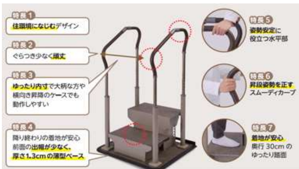
ステップサポート手すりの特長

スムーディーステップサポートとは・・・大きな段差の昇降を支える据え置き手すり。 54cmの段差まで対応でき、かまちの高さが高い玄関や掃き出し窓での設置に向く。